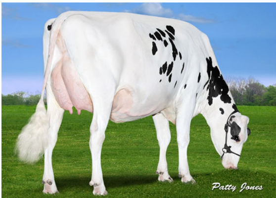
CLAYNOOK COLITA BOMBERO THIRD DAM