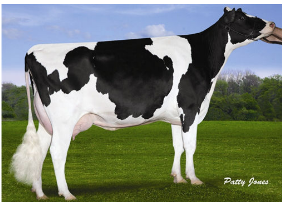
CLAYNOOK CHAR M O M FIFTH DAM