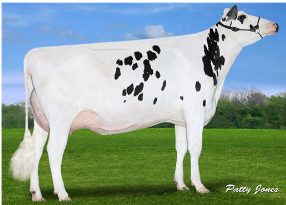
CLAYNOOK COLITA BOMBERO THIRD DAM